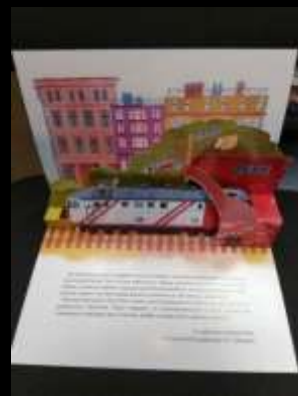
Открытка ко Дню Железнодорожник а для компании «ЛокоТех»