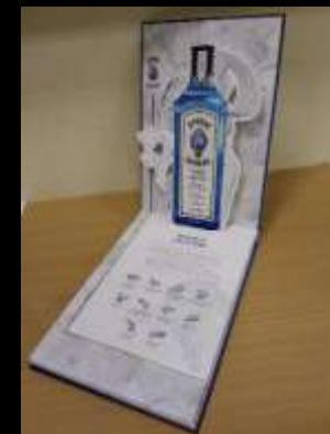
Книга-меню для ТМ «Баккарди» (джин «Сапфир»)