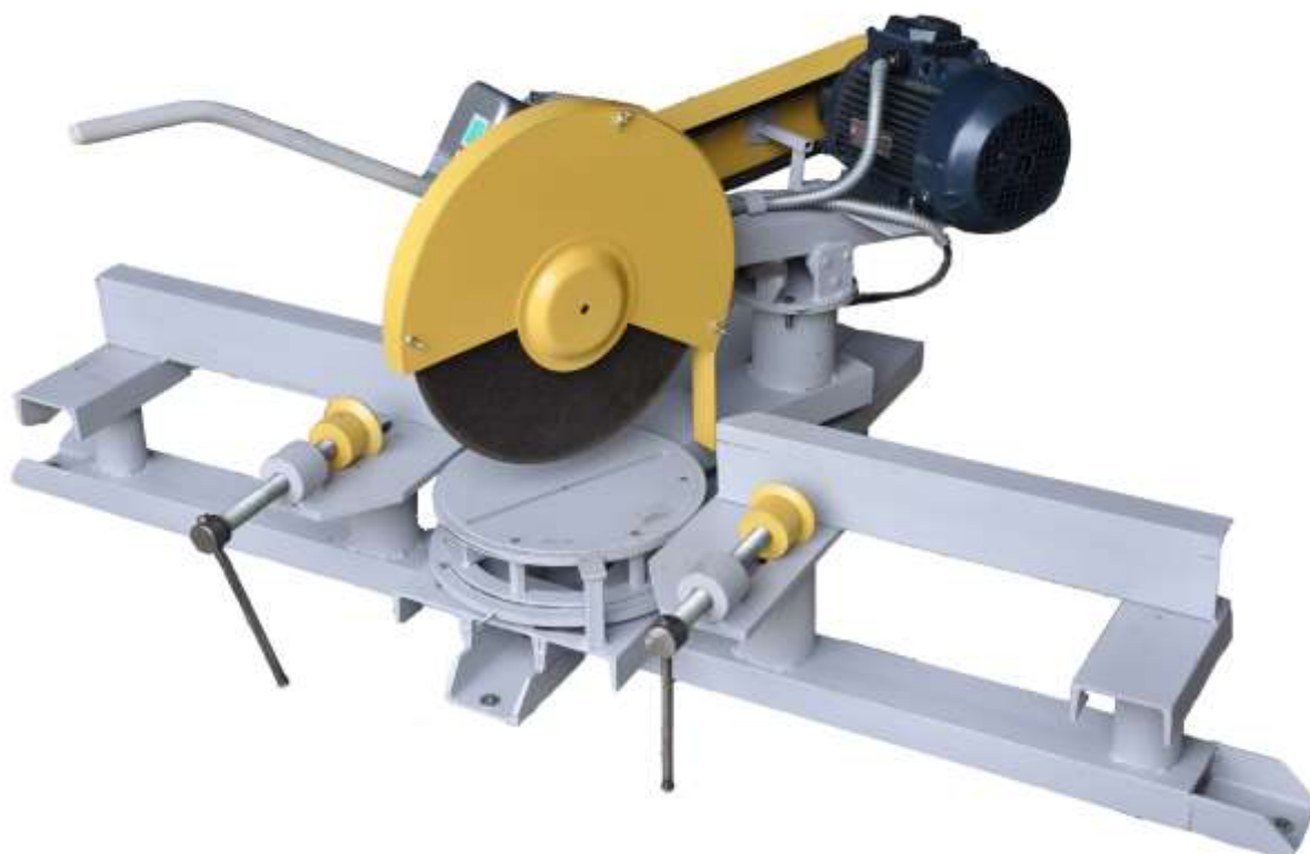
Станок СОП-400 с поворотной головкой 5,5кВт

Станок абразивно-отрезной поворотный СОП-400 предназначен для резки металлопроката под углом , с помощью абразивных кругов изготовленных по ГОСТ 21963-82.